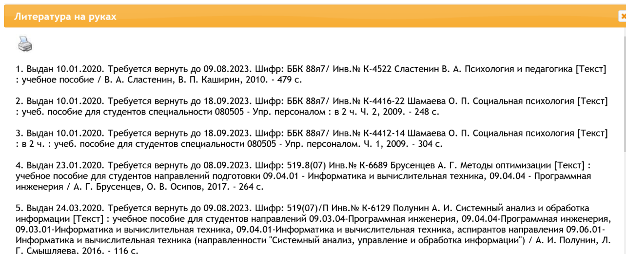
Рис. 2 Формуляр читателя Web-ИРБИС64+. Просмотр литературы, имеющейся на руках

✓ Просмотр списка полученной на дом литературы (ссылка «Литература на руках») (рис. 2).